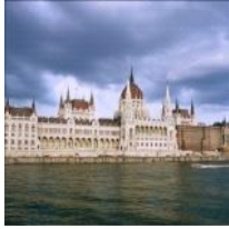
死后：一片极大的属于自己的地方