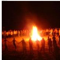
死后：回归了你所敬畏的大自然