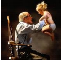
临死前：发现安定不了